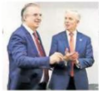
CONTESSA Y JIM. EBRARD

México y Estados Unidos acordaron extender las conversaciones con nuevas rondas de negociación en junio y julio. Finanzas